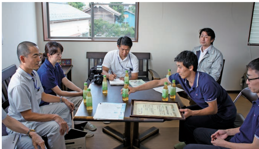
認証を受け新聞社から取材を受けるHACCPメンバー（写真左）と農場HACCP認証書（写真右）