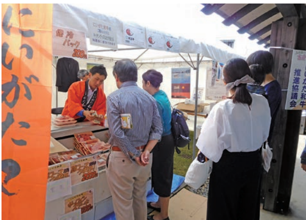
（昨年度のにいがた和牛推進協議会出展の様子）

また、当協会が事務局である「にいがた和牛推進協議会」も昨年度に引き続き出展します。新潟県産和牛のブランドである「にいがた和牛」の消費拡大・おいしさを皆様にPRすべく、協議会会員の食肉会社（よねー）からご協力をいただき、「にいがた和牛」を売り切れ御免の会場限定特別価格で販売します。さらに、今年は「にいがた和牛」をその場で楽しめるメニューも登場するとか！？どんなメニュー、美味しさかはぜひ会場でチェックしてみてください。