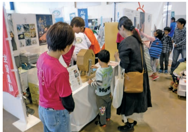
（昨年度のにいがた畜産女子会活動の様子）

こちらで紹介した以外にも、様々な楽しいイベントが目白押しです。ぜひ、お近くへ起こしの際は、新潟ふるさと村へ足を延ばしてみてください。