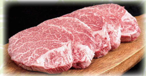
(左上：Diner's Kitchen Woody 料理、左下：新発田牛料理、右：お取り寄せにいがた和牛商品)