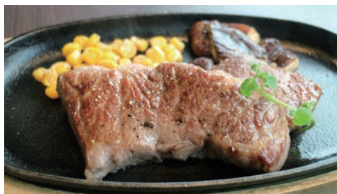
ステーキに使う部位はその時々で違うので、何が食べたいかはお楽しみ♪ (写真はショートトリブ・150g) (ライス・サラダ・スープ付き 税込3,200円)

料理のコンセプトは、「肉のおいしさを味わえて、かつ、1頭丸ごと、部位の無駄なく使えること」。牛を大切にしている小田さん一家の思いが表れています。