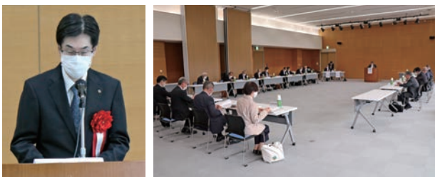
祝辞を述べる遠山農林水産部副部長（左）と定時総会の様子（右）