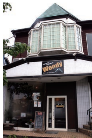
外観も内観もおしゃれな雰囲気 村上駅から徒歩約2分の好立地にあります。