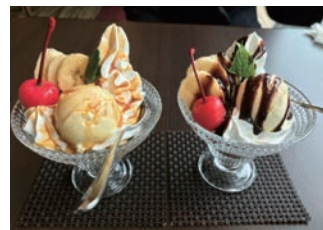
セットメニューのミニパフェ。 (ランチデザート 税込250円) 単品では大きいサイズ(税込550円)もあります。