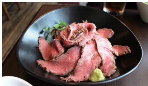
肉を贅沢に使ったローストビーフ丼は、花が咲いたようなおしゃれな盛り付け。 (サラダ・スープ付き 税込1,500円)