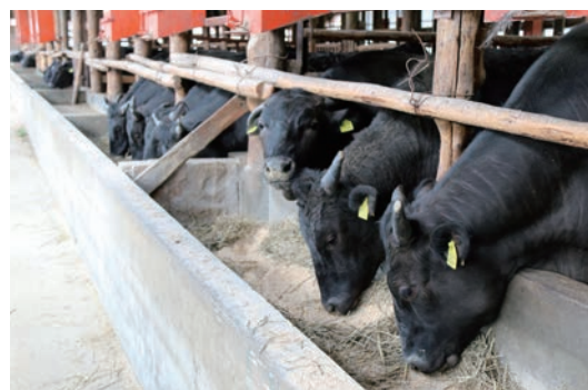
新発田市で飼養される肥育牛 肉質4等級以上が新発田牛となります。