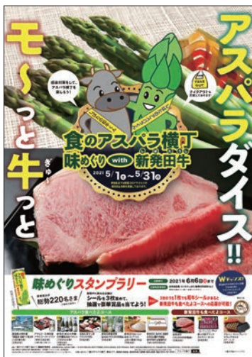
アスパラガスとのコラボイベント (現在は終了しています。)

昨年8月に、「新発田産和牛消費拡大事業実行委員会」を立ち上げました。JA北越後や生産者だけではなく、飲食店、旅館、流通事業者の方々にも加入いただき、生産、流通、消費の面で幅広くバックアップできる「オール新発田」の構成となりました。