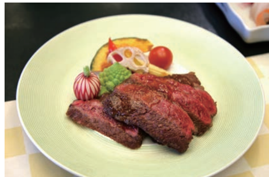
新発田牛のステーキ

ブランド化に取組みきっかけのひとつとして、新型コロナウイルスの影響がありました。消費が低迷し価格も低下するなどの影響を受けましたが、このピンチをチャンスに変えようと消費拡大とブランド化に取組みました。