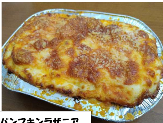
パンプキンラザニア