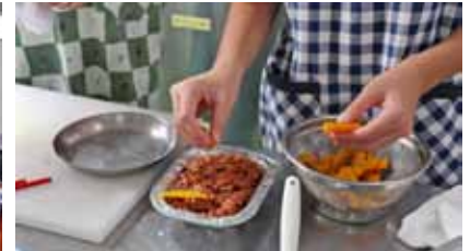
親子料理教室の様子