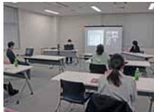
女子会経理研修会の様子