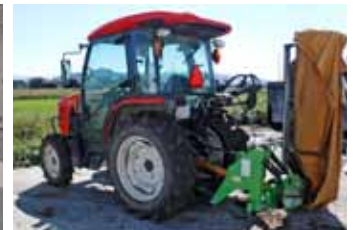
クラスター事業導入機械の一例