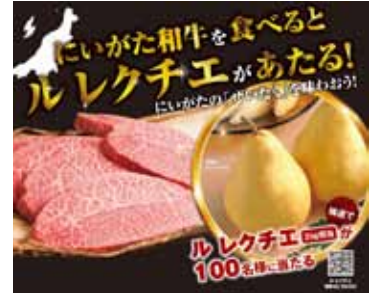
令和3年度キャンペーンポスター