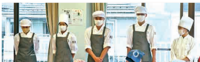
専門学校のスタッフさんが丁寧にサポートしてくれました。

当協会では同様に「にいがた和牛」を食材とした料理教室の開催を、2月26日にも予定しています。