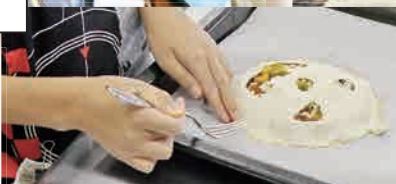
うまく焼きあがるかな？