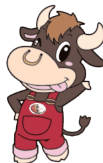
にいがた和牛 イメージキャラクター 「ニーモ」

にいがた和牛推進協議会では、和牛生産や「にいがた和牛」へ一層の理解と親しみを持ってもらい、消費拡大を図ることを目的に、優れた生産技術を持つ「にいがた和牛肥育名人」が県内小中学校を訪問する出前授業を11月から12月にかけて5校を対象に実施しました。