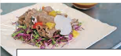
牛肉のカップサラダ