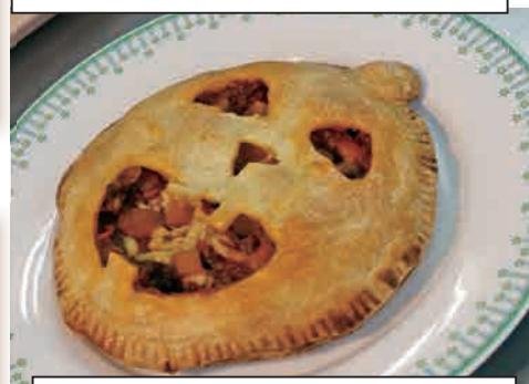
ハロウィンかぼちゃミートパイ