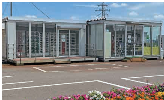
ツバメファーム（燕市道金485番地）の自動販売機

一生懸命作ったこだわり卵をすぐにお届けできるように、自動販売機で24時間直売しています。ぜひ一度食べてみて下さい。