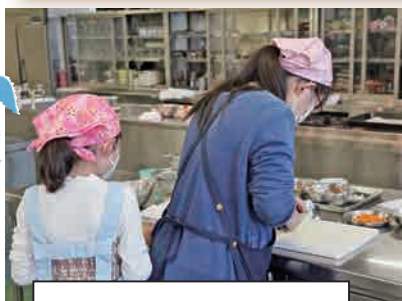
玉ねぎが目にしみる！