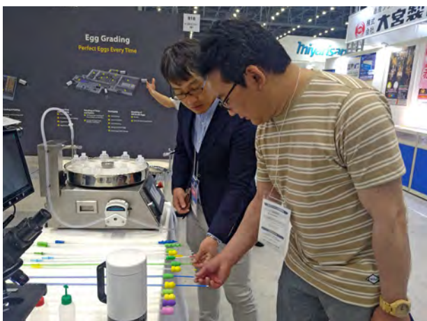
メーカーの話を聞く新潟県内の養豚生産者

てから導入する必要があると感じました。一方、疑問に思う機械、技術等もたくさんあるので、吟味する眼力も必要と感じました。