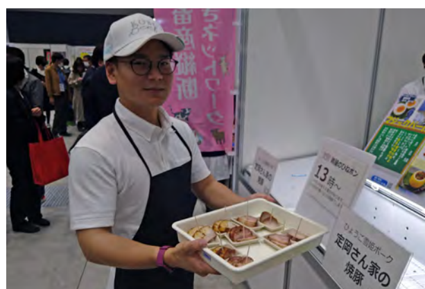
近畿ブロックの焼豚試食

全体的な感想としては、これからの時代はIoT/ICT化が重要ということが再認識できましたが、費用対効果を十分に検証し