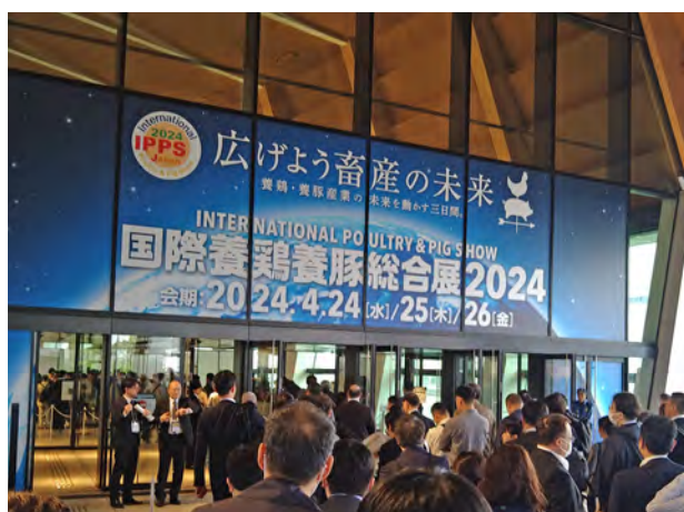
開場時に行列ができるほど人気

一方、これからの時代は、地球環境問題を解決するため、SDGs や DX への対応が求められています。出展した各施設・機械メーカーは、養鶏・養豚産業の更なる発展に貢献するべく、これらの課題に真正面から取り組んでおられました。