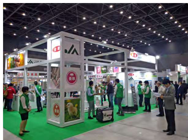
展示ブースの一例