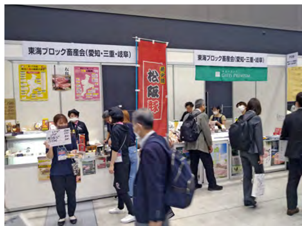
東海ブロック・近畿ブロックが出展

最後になりますが、畜産会組織の中で東海ブロックと近畿ブロックが出展しており、各地域の銘柄豚の試食やPR活動を行っていました。次回の2027年には北陸ブロック（新潟・富山・石川・福井）も何かしらの形で出展することを模索していきたいと思っています。