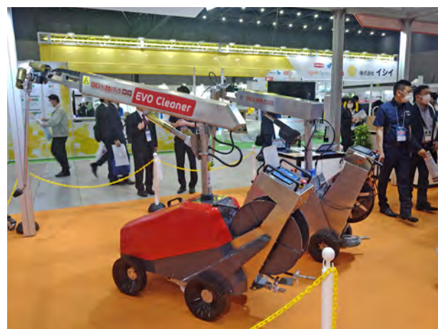
畜舎清掃ロボット