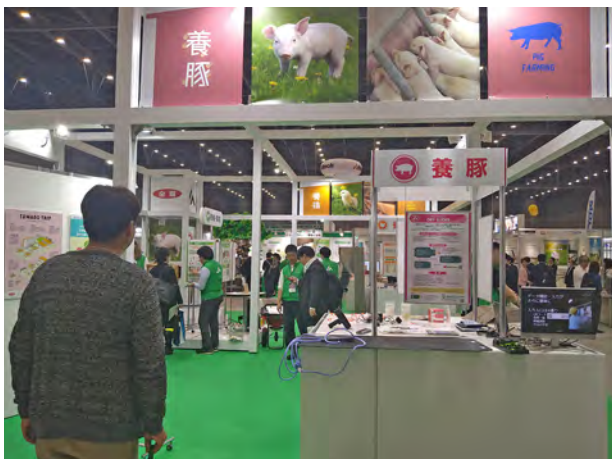
会場で情報収集する新潟県内の養豚生産者

会場には多くの新潟県内の養豚生産者が訪れており、実際に機械・施設に触れたり、メーカーの話を聞いたり、セミナー聴講で最新技術を確認するなど、自身の経営にプラスとなる情報収集に努めていました。