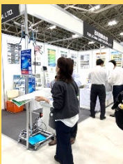
様々な出展企業から商品の説明を受けました

農業WEEKは3日間開催され、約900社が出展、来場者数延べ3万人の大規模なイベントです。なので、参加者は各自ブースを周り、最新技術や農場で使用する機械や資材について情報収集をしました。