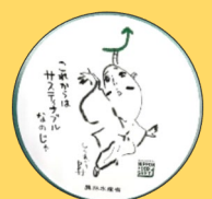
農水省のブースで見つけたステッカー

FOOD展は、食品の加工や調理機器、流通などがメインのイベントですが、加工食品の輸出についてのコーナーやHACCPに関する書籍も販売しており、六次産業に繋がる情報のみならず、畜産の現場に応用できる情報が多々あったように感じました。