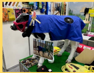
最新技術の情報収集