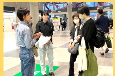
イベント終了後の情報共有